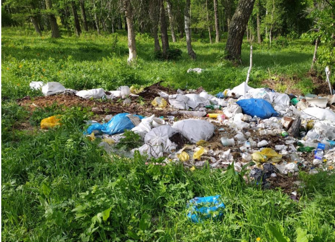
Населенный пункт: 86-06-0002. Водоем не стихает за коды вызывает