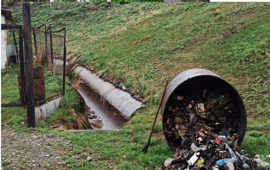
Муниципальное предприятие «Сельхозтехника» г. Троицк, Республика Алтай, 03.06.2022 года