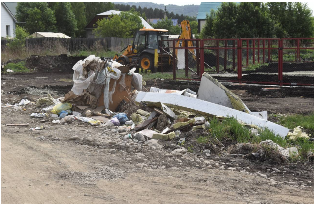
Караул Алтайский. Контактный номер телефона: 81-95-0002. Дорогу-твердному